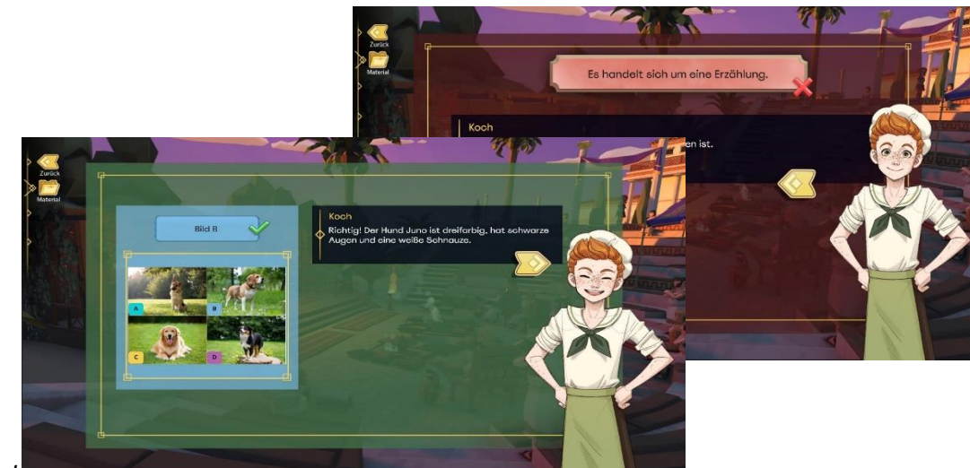
Beispielhafte Darstellung von Feedback zu einer falsch sowie zu einer richtig gelösten Aufgabe (aus den Entwürfen des Lerntools Deutsch)