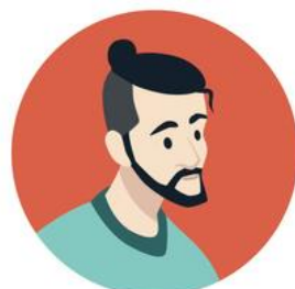
Begleitung und Motivation durch Mentorinnen und Mentoren