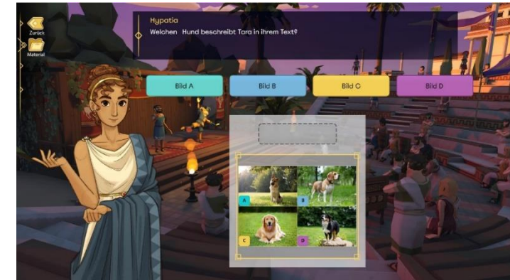
Beispielhafte Darstellung einer Aufgabe (aus den Entwürfen des Lerntool Deutsch)