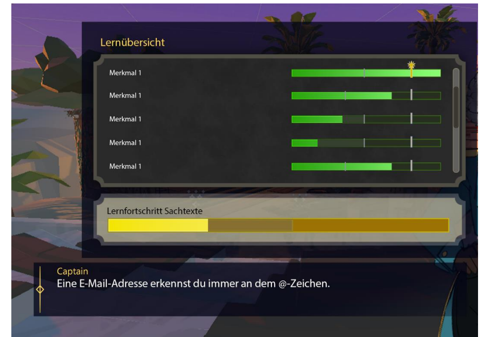
Beispielhafte Darstellung des individuellen Lernfortschritts (aus den Entwürfen des Lerntool Deutsch)