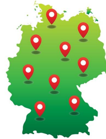
Deutschland- und/oder Stadtkarte mit verschiedenen Stationen