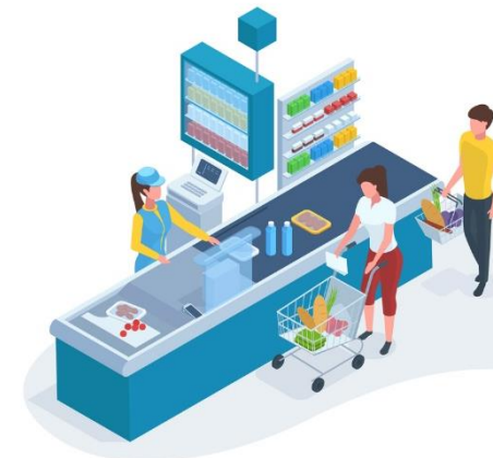
Durch alltägliche Situationen Sprache und Kultur kennenlernen