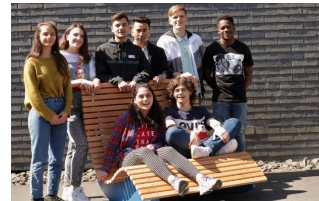
Relaxliegen: Eifel-Gymnasium Neuerburg