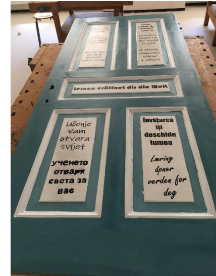
Landgraf-Ludwig-Schule Pirmasens u. IB: Türprojekt SJ 21/22