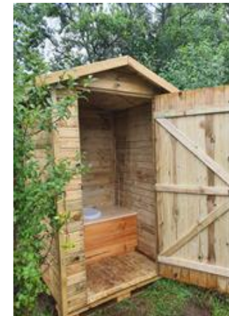
CJD: Komposttoilette.