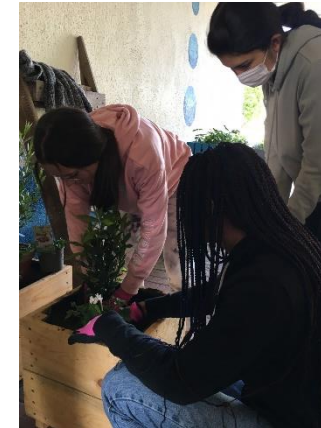
BBS Pirmasens u. IB: Pflanzprojekt SJ 21/22